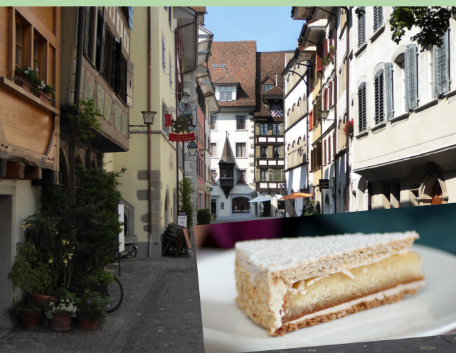
AUSFLUG ZUG & KIRSCHTORTE | 14.09.