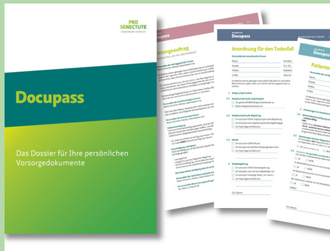
PATIENTENVERFÜGUNG | 23.11.