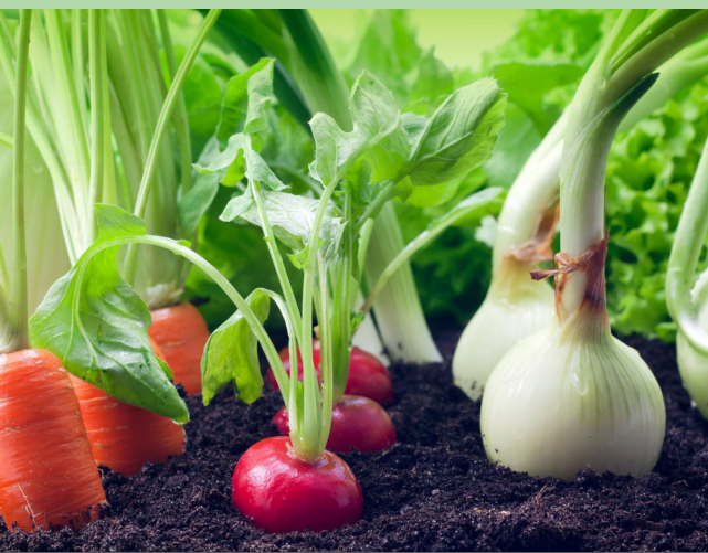
QUER DURCH'S GARTENJAHR | 08.04.