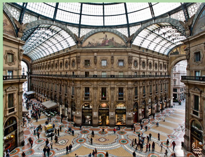
SHOPPING IN MAILAND | 21.10.