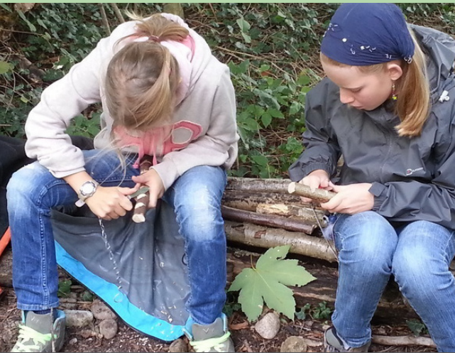
NATURERLEBNIS / SACKMESSER | 13.05.