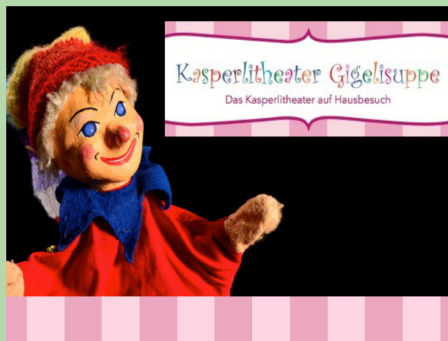
KASPERLITHEATER | 20.12.