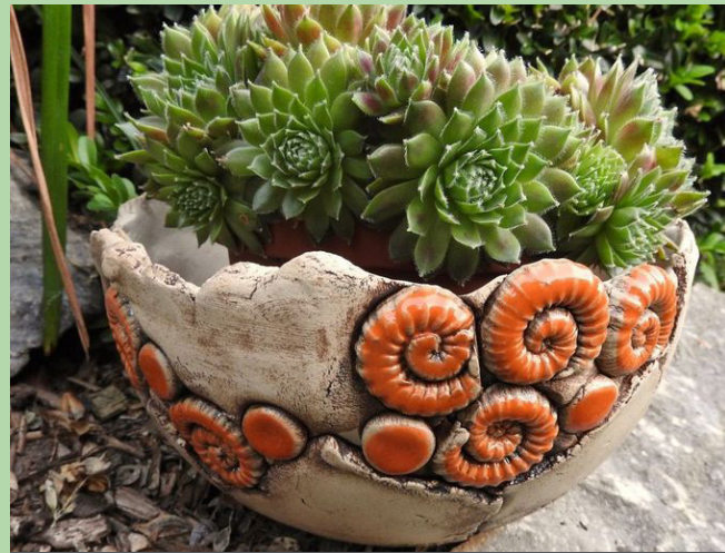
TÖPFERN FÜR ERWACHSENE | 8. & 15.11.